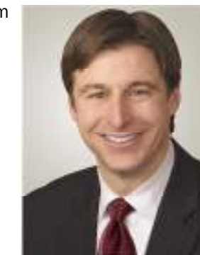
Hon. Shawn Graham Premier ministre du Nouveau-Brunswick Premier of New Brunswick

Pour vous inscrire téléphonez au 743-7337. Les sièges sont limités.